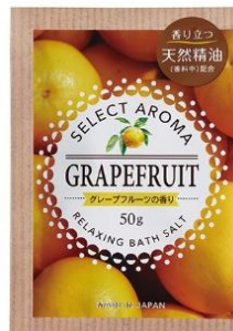
セレクトアロマ グレープフルーツの香り