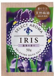
セレクトアロマ 菖蒲の香り