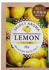
セレクトアロマ レモンの香り