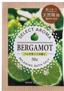
セレクトアロマ ベルガモットの香り

半透明で粒状のバスソルト。湯色は透明。 【使い方】浴槽のお湯約200Lに1包50gを入れ、よくかき混ぜてからご入浴ください。