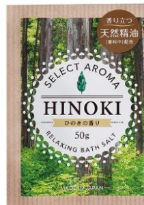
セレクトアロマ ひのきの香り