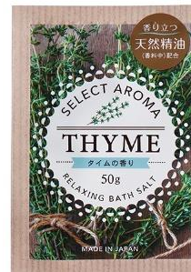
セレクトアロマ タイムの香り