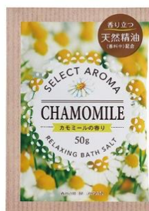
セレクトアロマ カモミールの香り