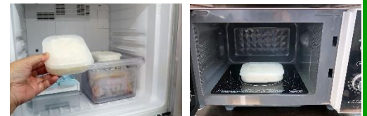
ご飯をコンパクトに冷凍保存。電子レンジ OK。