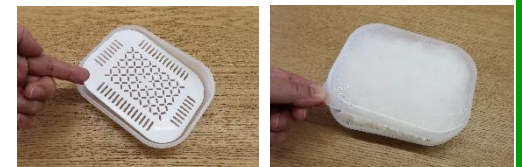
スノコの一角に指穴付き。 フタはツマミ付き。