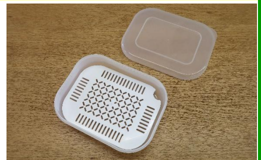
容器、スノコ、フタの冷凍ご飯保存容器 200g 用。