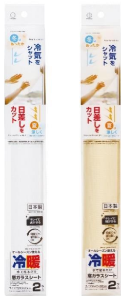
ホワイト ベージュ