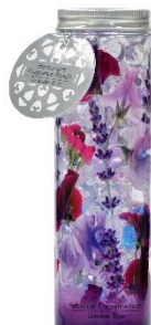
ラベンダー・レーヴ 品番 3871 JAN 4956810238712