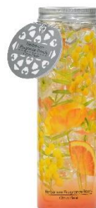
シトラス・プレジール 品番 3873 JAN 4956810238736