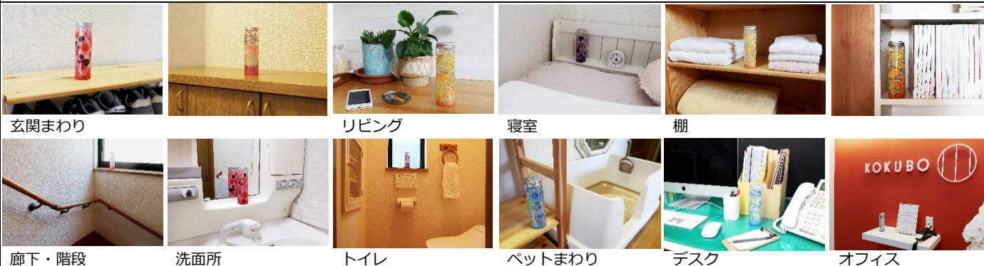
玄関まわり リビング 寝室 棚 廊下・階段 洗面所 トイレ ベットまわり デスク オフィス

中身は透明とカラーが混ざった香り付きの消臭ビーズ。 (中身は出さないでください)