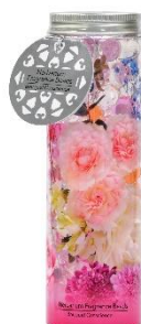
ブーケ・コンシアンス 品番 3872 JAN 4956810238729