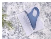
厚手のクッションメッシュ