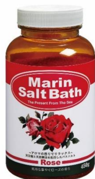
マリンソルトバス ローズ