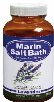
マリンソルトバス ラベンダー