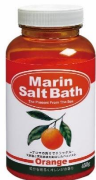
マリンソルトバス オレンジ