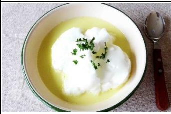
メレンゲかぼちゃポターージュ https://cookpad.com/recipe/5579318