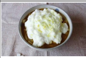
メレンゲカレーうどん https://cookpad.com/recipe/5579308