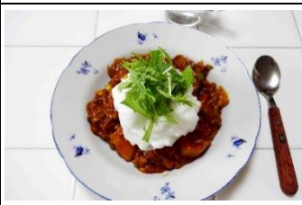
メレンゲハヤシライス https://cookpad.com/recipe/5579294