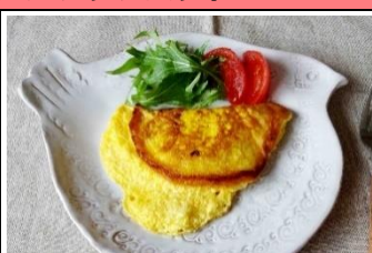
メレンゲオムレツ (卵焼き) https://cookpad.com/recipe/5579341