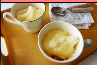
マグカップオムライス https://cookpad.com/recipe/5898382