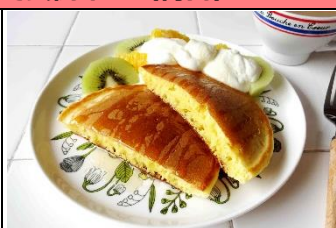
メレンゲパンケーキ https://cookpad.com/recipe/5579331