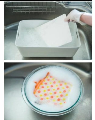
書籍「料理グッズで簡単！おうちごはんとおべんとう」 KOKUBO 著 誠文堂新光社（発売中）より レシピ考案：星野奈々子（料理家・フードコーディネーター） スタイリング：つがねゆきこ

菌は外出先だけでなく、家の中にも入り込む可能性があります。身に触れる食器やキッチン周り、衣類、部屋のあちらこちらなど、気になり出したらきりがありません。見えない菌を恐れて疲弊するよりも、ふだんの家事で簡単に除菌対策しながら、家じゅうをスッキリ清潔にして、気分よくすごす方法をご紹介します。