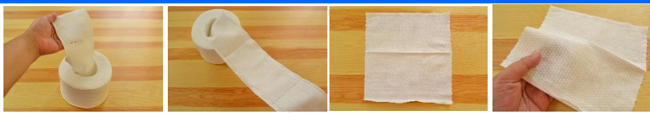
1ロール70シート入 ミシン目でちぎる 1シート約20×22cm 凹凸のある織

材質：レーヨン シートサイズ：約20×22cm(1枚) 数量：1ロール(約70シート分) 1ロールサイズ：11×15×15cm オープン価格 (参考価格 税別 800円 税込 880円) 発売元：KOKUBO 発売日：2020年3月10日新発売