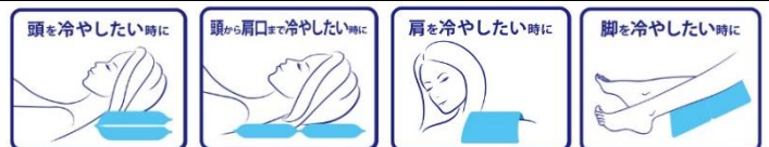
2連大型サイズは2つ折りで枕として、広げてマットとして使えます。

◎夏の暑さ対策に！ ◎首周り・背中への冷却に！ ◎手首・足首の冷却に！ ◎繰り返し使えます サイズ：約 37×30cm (2連大型サイズ) 日本製 ひんやり持続 10 時間 ※弊社温度試験結果による 参考価格：税別 1,600 円 税込 1,728 円 ※オープン価格 発売元：紀陽除虫菊(株) 発売日：2015年6月25日