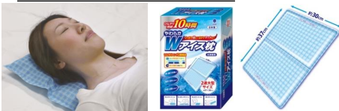
↑広げて頭から肩まで使用したイメージ (実際はタオルなどを敷いて使用)

◎夏の暑さ対策に！ ◎首周り・背中への冷却に！ ◎手首・足首の冷却に！ ◎繰り返し使えます サイズ：約 37×30cm (2連大型サイズ) 日本製 ひんやり持続 10 時間 ※弊社温度試験結果による 参考価格：税別 1,600 円 税込 1,728 円 ※オープン価格 発売元：紀陽除虫菊(株) 発売日：2015年6月25日