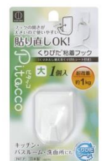
ピタッコ くりぴた粘着フック 大 1個入 耐荷重：約 1kg

>> KOKUBO 公式オンラインショップ http://kokuboshop.com