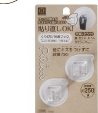
ピタッコくりぴた粘着フック ミニワイド 2個入 <透明シール付> 耐荷重：約 250g