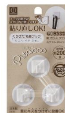
ピタッコ くりぴた粘着フック ミニワイド 3個入 耐荷重：約 200g