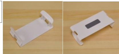
壁ピタティッシュ 表面 裏面（粘着シート付）