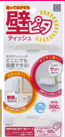
「壁ピタティッシュ」