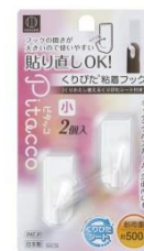
ピタッコ くりぴた粘着フック 小 2個入 耐荷重：約 500g