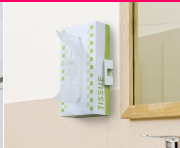
<洗面所の壁にピタ！>