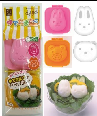
「ゆでたまごっこ」 うさぎ&くま (2 個入)

【作り方】卵をゆでて殻をむき熱いうちに型に入れてフタをします。冷水で 10 分冷やすとかわいい形に変身