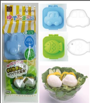
「ゆでたまごっこ」 さかな&くるま (2 個入)