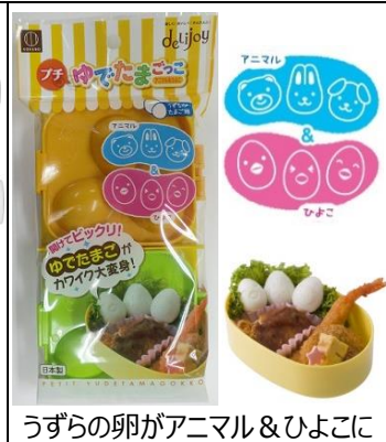
うずらの卵がアニマル&ひよこに 「プチゆでたまごっこ」 (2 個入 うずら卵 6 個分)