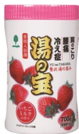
いちごミルクの香り

医薬部外品 内容量：700g (1回25g使用の場合、約28回分) 参考価格：税込540円 発売元：紀陽除虫菊(株) 発売中