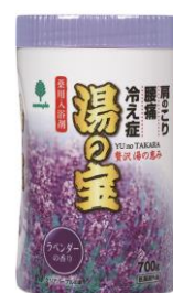
ラベンダーの香り