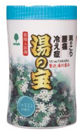
ジャスミンの香り