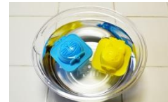
冷水で10分冷やすと