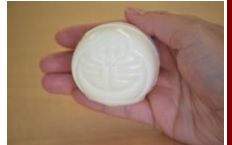
かわいい形に变身!