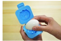
ゆで卵を型に入れて

【レシピ】クックパッド KOKUBO キッチン http://cookpad.com/kitchen/10079089