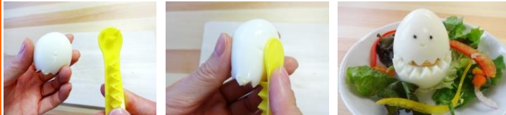
(おまけ) 本体の顔部分をぎゅっと押してごまを入れればキュートな顔に