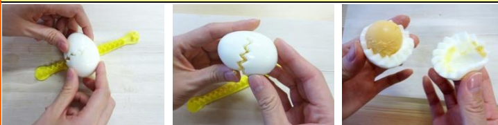
①端にゆで卵を置いて転がす ②一周したらゆっくりはずす ③ゆで卵の花に