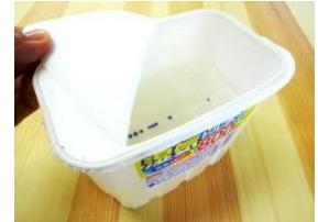
空気中の余分な湿気を吸い取り、水がたまります。除湿量が見えます。