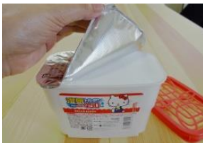
アルミシートをはがし、フタをして押入れや洋服タンスに置きます。