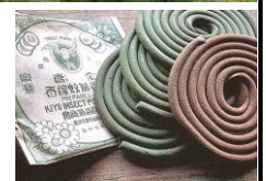
昔の手巻式蚊取り線香