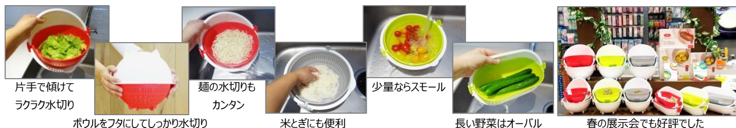
片手で傾けてラクラク水切り