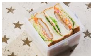
メッシュプレートの上にサンドイッチを