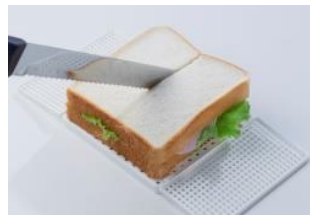
パンを切るまな板としても使えます