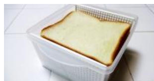
食パンをそのまま保存するのにも OK