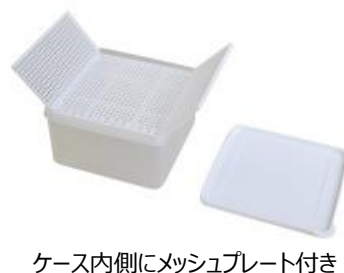
ケース内側にメッシュプレート付き